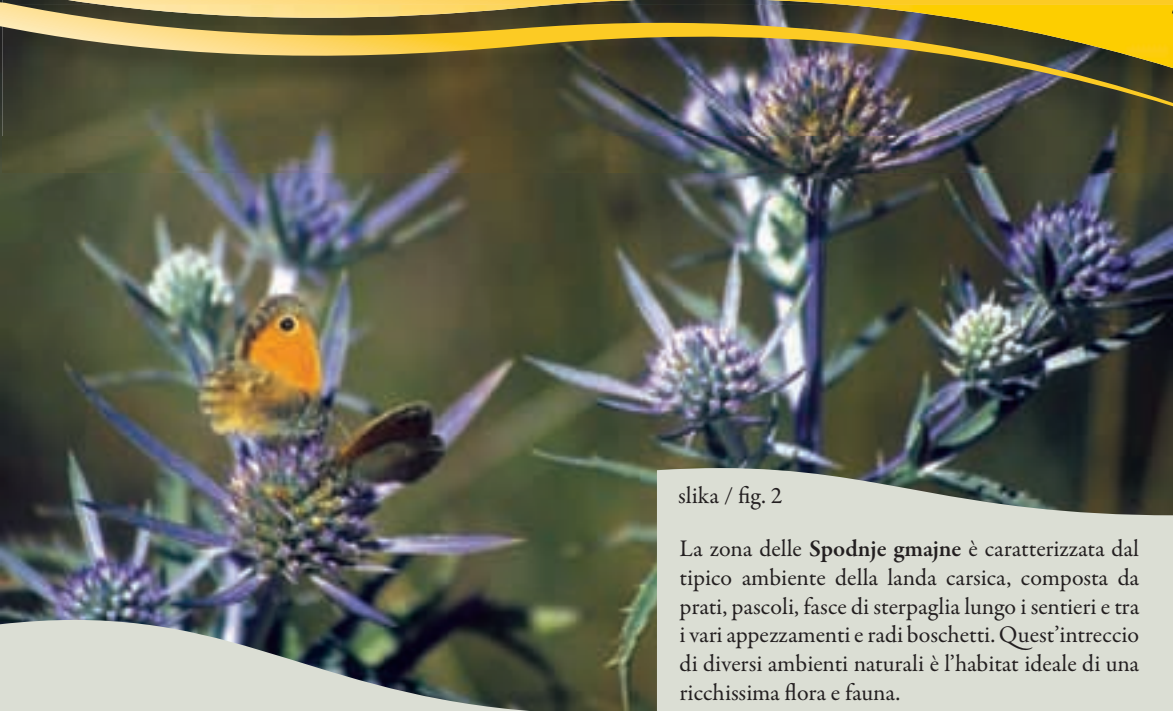
slika / fig. 2

La zona delle Spodnje gmajne è caratterizzata dal tipico ambiente della landa carsica, composta da prati, pascoli, fasce di sterpaglia lungo i sentieri e tra i vari appezzamenti e radi boschetti. Quest'intreccio di diversi ambienti naturali è l'habitat ideale di una ricchissima flora e fauna.