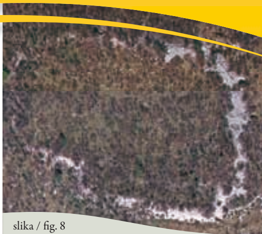
slika / fig. 8

Lasciamo la Lojzova jama e risaliamo, attraversiamo il sentiero e, passando accanto ai resti delle trincee, ci dirigiamo verso la cima del Grmača.