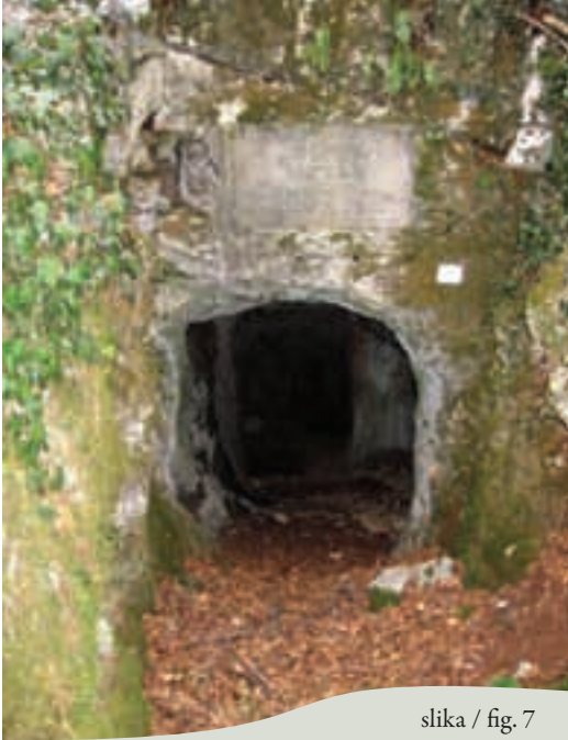
slika / fig. 7

Od Klobasje jame ni po omenjenem kolovozu daleč do sosednje, Lojzove jame, skrite nekoliko globlje v zavetju okoliških vzpetin.