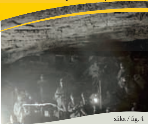
slika / fig. 4

Naravno kraško jamo so avstro-ogrski vojaki med prvo svetovno vojno preuredili v zavetišče za vojake. Sprva je bilo v njej skladišče živeža, posebej krompirja, zaradi česar so jo imenovali Krompirjeva jama . Pozimi 1916/17 so jo preuredili za namestitev čet. V njej je bivalo do 500 vojakov. V jami je bil periskop, vodni rezervoar, kuhinja, telefonska centrala, skladišče streliva, poveljniška soba, sanitarije. Pogradi za počitek so bili razdeljeni v tri in štiri nadstropja. Prezračevanje je bilo naravno. Ob prezračevalni odprtini je stal betonski mitralješki bunker. Ob vhodu je postavljen betonski zid s strelskimi linami, ki je služil za obrambo vhoda. Vhod se odpira na dnu doline, do njega pa vodijo dolge, kamnite stopnice (slika / fig. 3).