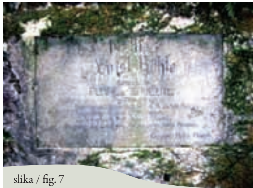
slika / fig. 7

Poco distante lungo il sentiero si trova la Lojzova jama, nascosta un po' più in profondità negli anfratti delle alture circostanti.