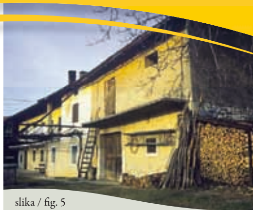
slika / fig. 5

Lasciando la grotta, risaliamo verso il bivio sulla linea ferroviaria e dirigiamoci verso nord. Dopo circa 700 metri raggiungiamo il paese di Novelo e scendiamo attraversando l'abitato.