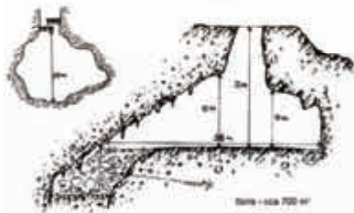
slika / fig. 4

Si tratta di una grotta carsica naturale che i soldati austro-ungarici trasformarono, durante la Prima Guerra Mondiale, in un rifugio. Inizialmente ospitava un deposito di vettovaglie, soprattutto patate, da cui prese il nome di Krompirjeva jama , che significa appunto 'grotta delle patate'. Nell'inverno tra il 1916 e il 1917 fu adibita a rifugio per le truppe e poteva ospitare fino a 500 uomini. Nella grotta era installato un periscopio, c'erano un serbatoio per l'acqua, una cucina, una centrale telefonica, un deposito di munizioni, la stanza di comando e i servizi igienici. I tavolacci per dormire erano disposti su tre o quattro piani. Il sistema di aerazione era naturale. Accanto all'apertura per l'aerazione era sistemato il bunker di cemento della mitragliatrice. In prossimità dell'ingresso era stato costruito, a difesa, un muro di cemento con delle feritoie. L'ingresso si apre sul fondo della dolina e si raggiunge scendendo una lunga scalinata di pietra.