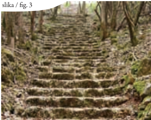
slika / fig. 3

Raggiungiamo il sentiero sterrato verso destra, camminando tra i muretti di pietra e dopo circa 200 metri, lasciamo il sentiero dirigendoci a sinistra, attraversando un terreno coperto di vegetazione, fino a raggiungere l'ingresso della Krompirjeva jama (slika / fig. 3).