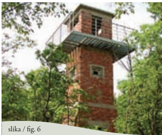
slika / fig. 6

Dalla chiesa, continuiamo verso sud. Prima del cimitero, imbocchiamo a sinistra una strada sterrata che costeggia il confine con l'Italia. Quando incontriamo dei bivi, ci teniamo sempre sulla destra. Sull'altura di Županov vrh si erge, poco distante dal sentiero, una torre panoramica in mattoni.