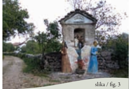
slika / fig. 3

S trga sledimo cesti med hišami proti jugozahodu, ki nas že izven naselja pripelje do kapele.