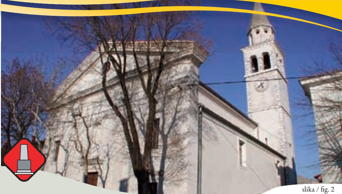
slika / fig. 2

Lunghezza/ durata dell'escursione: 5,2 km, 1 - 2 ore Difficoltà: non impegnativo Punto di partenza: parcheggio antistante il negozio ad Opatje selo. Informazioni: Info center (ex scuola di Temnica)