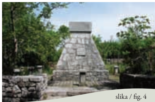
slika / fig. 4

Al bivio dietro la cappella, dove la strada procede dritta verso Hišarji (Issari) e Mikoli (Micoli) in Italia [I 10], noi imbocchiamo invece la strada che risale verso sinistra e ben presto, sul Griža, diventa più pianeggiante, portandoci fino all'abitato di Nova vas. Arrivati alle prime abitazioni, ci imbattiamo in un monumento della prima guerra mondiale.