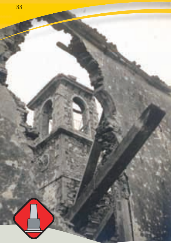
slika / fig. 1

Dolžina/ trajanje izleta: 5,2 km, 1 - 2 uri