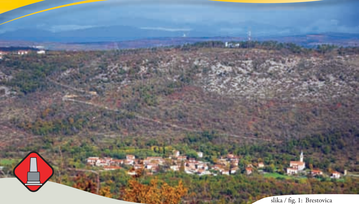
slika / fig. 1: Brestovica

Dolžina/ trajanje izleta: 9,3 km, 3-4 ure