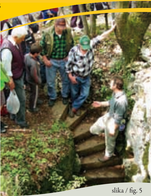
slika / fig. 5

Grofova jama je poševna fosilna jama s petimi vhodi, dolga 350 in 50 metrov globoka. Avstro-ogrska vojska jo je v prvi svetovni vojni preuredila v zaklonišče. V ta namen so skopali štiri rove in zgornji del jame preuredili v devet platojev za pograde. Ta del je tudi osvetljen in urejen za ogled, na dnu pa se rov prevesi v brezno, ki vodi v spodnje dvorane. V okolici jame je veliko ostankov utrdb, strelskih jarkov in kavern.