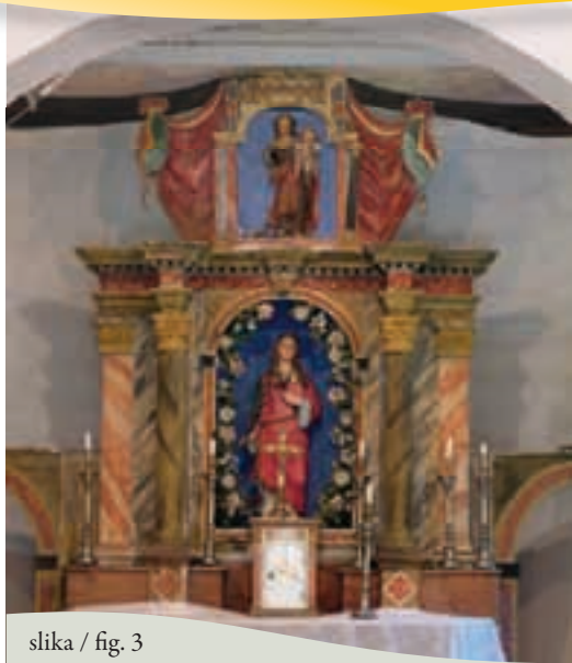
slika / fig. 3

La chiesa succursale di S. Anastasia, costruita probabilmente nel XV o XVI secolo, è formata da una piccola navata e dal presbiterio, dove è posto un altare barocco in legno con la scultura di S. Anastasia. Sul soffitto del presbiterio è rappresentata la SS. Trinità. Al posto del precedente campanile, dopo la Prima Guerra Mondiale fu costruito un porticato d'ingresso con un piccolo campanile. Secondo la tradizione orale, qui ci sarebbe stato, un tempo, un luogo di sosta e di riposo per i pellegrini diretti al monastero di S. Giovanni di Duino (Štivan).