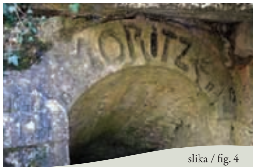
slika / fig. 4

Na Kuclju se pot obrne proti jugu, po pobočju navzgor. Čez približno pol ure dosežemo razpotje, kjer se levo odcepi kolovoz, ki mimo razgledišča pelje do naslednjega razpotja za Vrščem. Če gremo levo, se po dobrih dvesto metrih znajdemo pri zanimivih kavernah v eni od vrtač.