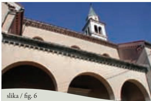
slika / fig. 6

Il sentiero sterrato che attraversa il versante sopra Brestovica ci conduce ad una strada boschiva lungo la quale, ammirando la vista sul Polje, ci avvicineremo a Brestovica. Attraversando Dolenja Brestovica, passiamo accanto alla chiesa e facciamo ritorno al punto di partenza presso la scuola.