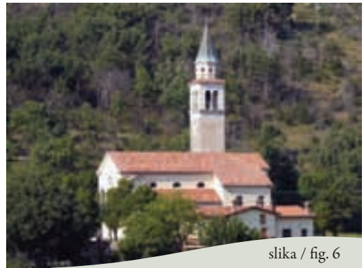
slika / fig. 6

Steza oziroma kolovoz, ki preči pobočje nad Brestovico, nas pripelje do gozdne ceste, po kateri ob pogledu na Polje zložno sestopamo proti Brestovici. Skozi Dolenjo Brestovico se mimo cerkve vrnemo do izhodišča pri šoli na robu vasi.