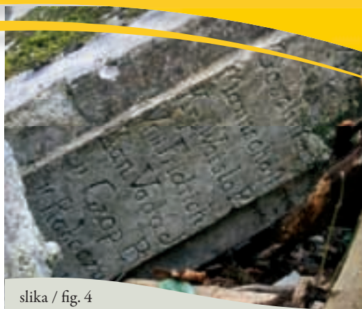
slika / fig. 4

Sul Kucelj il sentiero piega verso sud, risalendo il versante. Dopo circa mezz'ora, raggiungiamo una biforcazione: a sinistra il sentiero continua, lungo il belvedere, fino ad arrivare ad un altro bivio dietro il Vršec. Se andiamo a sinistra, dopo circa 200 metri incontriamo, in una delle doline, delle interessanti caverne.