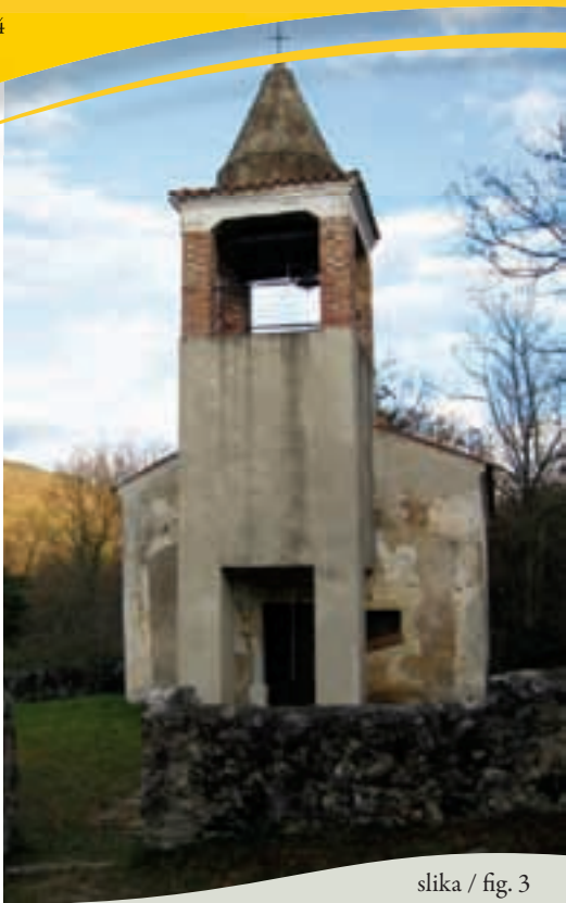
slika / fig. 3

Podružnično cerkev sv. Anastazije so zgradili v 15. ali 16. stoletju, sestavljena je iz manjše ladje in prezbiterja, kjer se nahaja lesen baročni oltar s kipom sv. Anastazije. Na stropu prezbiterja je slika sv. Trojice. Na mestu prejšnjega zvonika so po prvi svetovni vojni pozidali vhodno lopo z manjšim zvonikom. Po ustnem izročilu naj bi bila tu postaja in počivališče romarjev na poti v samostan v Štivanu.